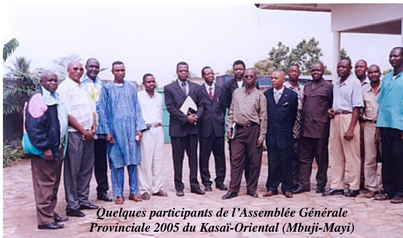
Quelques participants de l'Assemblée Générale Provinciale 2005 du Kasai-Oriental (Mbuji-Mayi)

Deux délégations du Secrétariat exécutif national du RIFIDEC ont séjourné du 29 mai au 05 juin 2005 à Mbuji-Mayi et à Kananga.