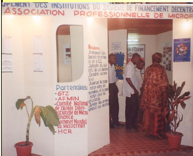
Vue du stand du RIFIDEC au pavillon 14 de la Foire Internationale de Kinshasa