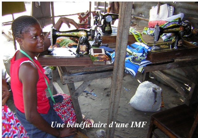
Une bénéficiaire d'une IMF

vail, de l'épargne aussi. Une activité commerciale est créée avec un capital de 10 dollars us : une douzaine de babouches constituent les premières "marchandises" à commercialiser. Des camarades viendront qui avec un sakombi d'arachide, qui avec un peu de cossettes de manioc. Et c'est parti.