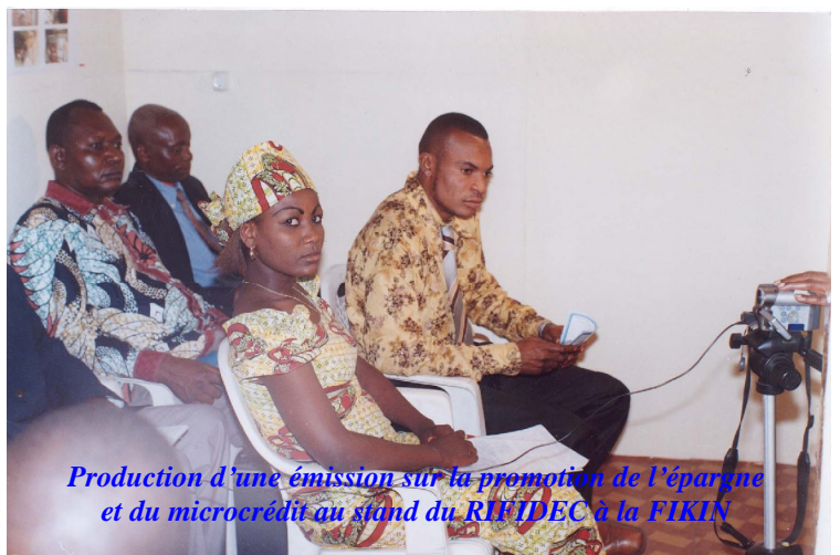
Production d'une émission sur la promotion de l'épargne et du microcrédit au stand du RIFIDEC à la FIKIN

Il couvre à ce jour une grande partie du territoire national. Des assemblées générales provinciales se tiennent depuis le début de l'année en vue du renouvellement des conseils d'administration, en attendant la grande assemblée nationale.