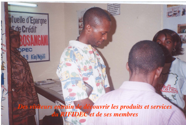
Des visiteurs entraînés de découvrir les produits et services du RIFIDEC et de ses membres