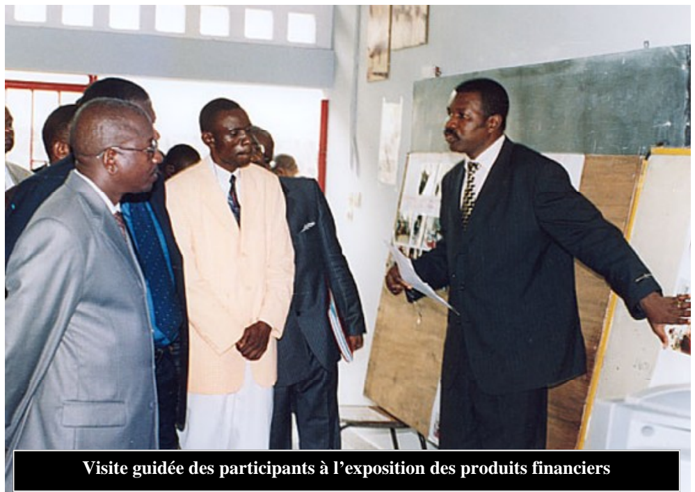
Visite guidée des participants à l'exposition des produits financiers