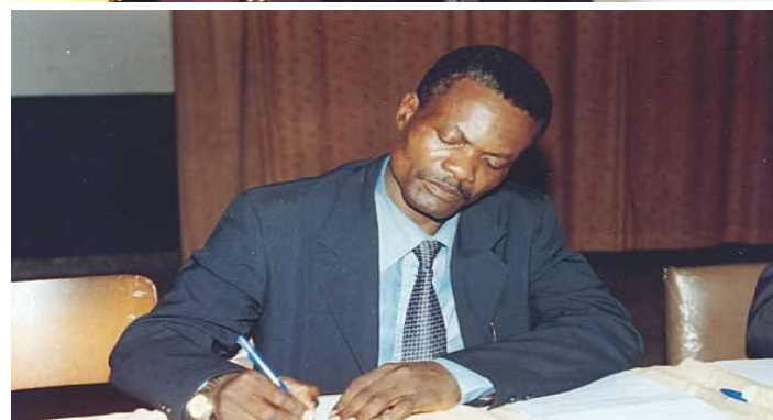
Une attitude du représentant de l'IMF HOPE RDC