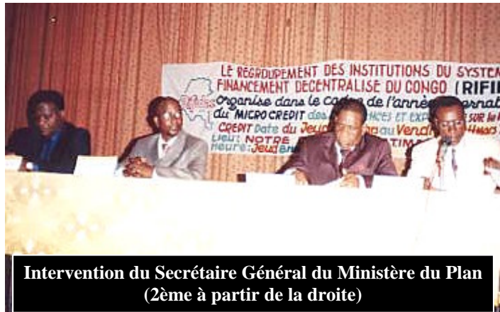
Intervention du Secrétaire Général du Ministère du Plan (2ème à partir de la droite)

après l'Année Internationale de Micro Crédit : problèmes, potentialités et besoins d'action ».