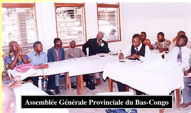
Assemblée Générale Provinciale du Bas-Congo