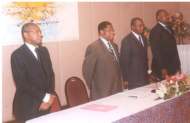
Une vue de la tribune lors de la cérémonie officielle du lancement des activités de l'année internationale du micro crédit

Bien plus, la culture étant le moteur du développement, les us et coutumes chez