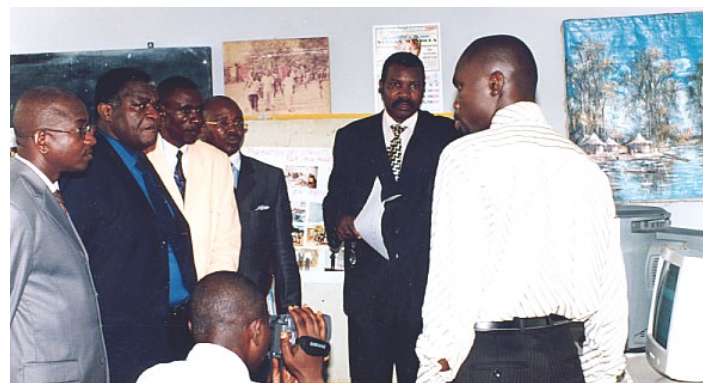
Explication des spécificités du site internet du RIFIDEC

membres, une gamme des produits et services et faciliter leur ouverture avec l'extérieur grâce à un système des réseaux.